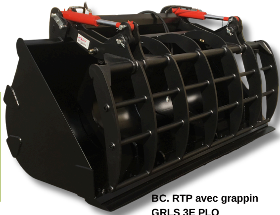
BC. RTP avec grappin GRLS 3E PLO