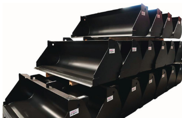
Dents boulonnées Bolted teeth