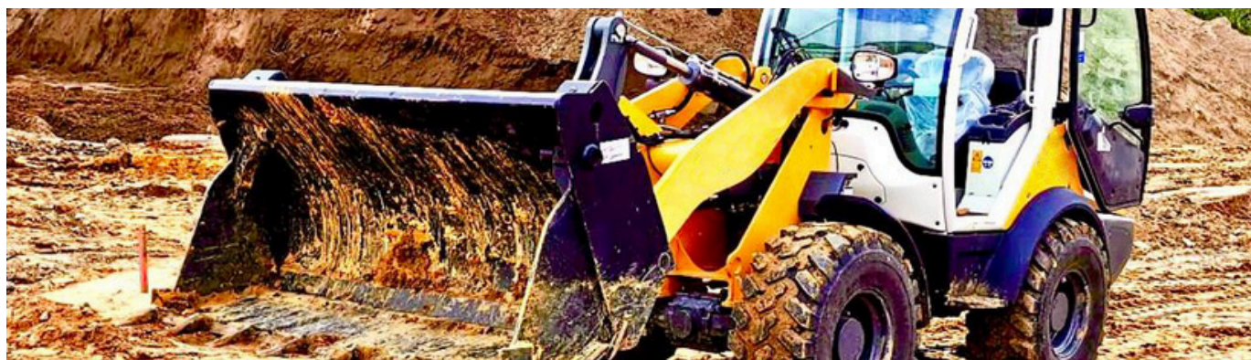
Poids approximatifs sans accrochage - photos non contractuelles / Approximate weight without hitch-non-contractual photos