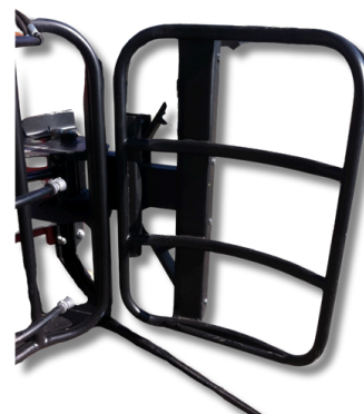
Option bras TUBULAIRE Tubular Model