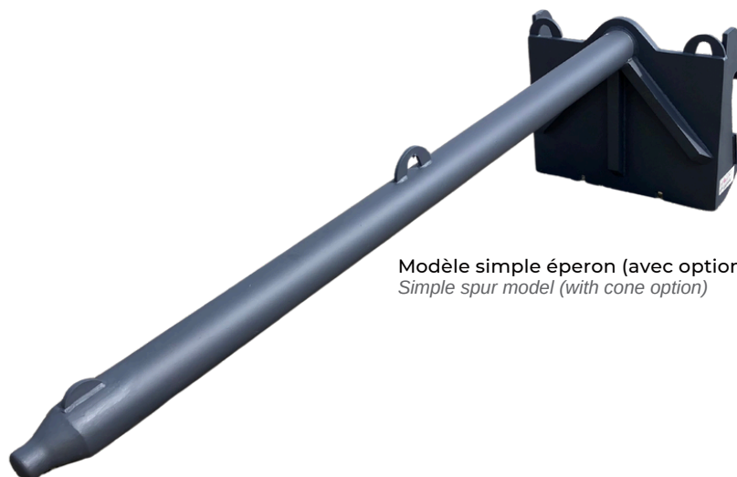
Modèle simple éperon (avec option cône) Simple spur model (with cone option)

Nouvel embout permet de faciliter l'entrée dans les anses de Big Bag