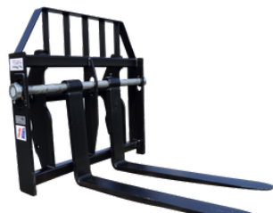
TPF.F avec dossier Fourches flottantes