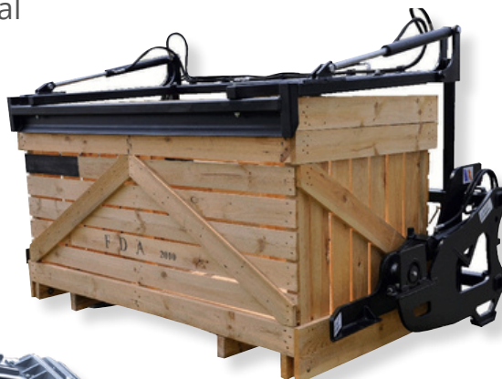
Cadre de maintien sur le dessus Support frame on top

Idéal pour la manutention intensive de PALOX Ideal for intensive handling of PALOX