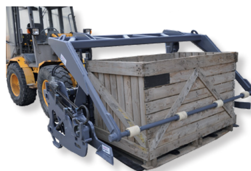
Cadre de maintien sur le dessus et devant avec rouleaux de protection en ertalon Ertalon roller frame